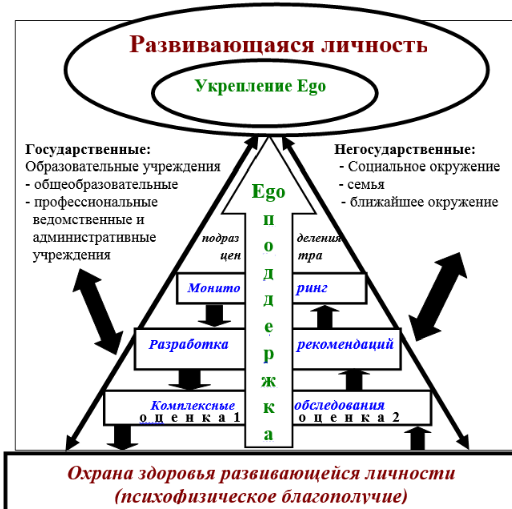
Рис. 2. Теоретическая модель психологической профилактики наркопотребления развивающейся личности в условиях центра психолого-педагогической помощи

организаций, движений, родительской общественности и других лиц, а также работа с ними, направленная на постоянное взаимодействие в интересах повышения эффективности проводимых мероприятий.