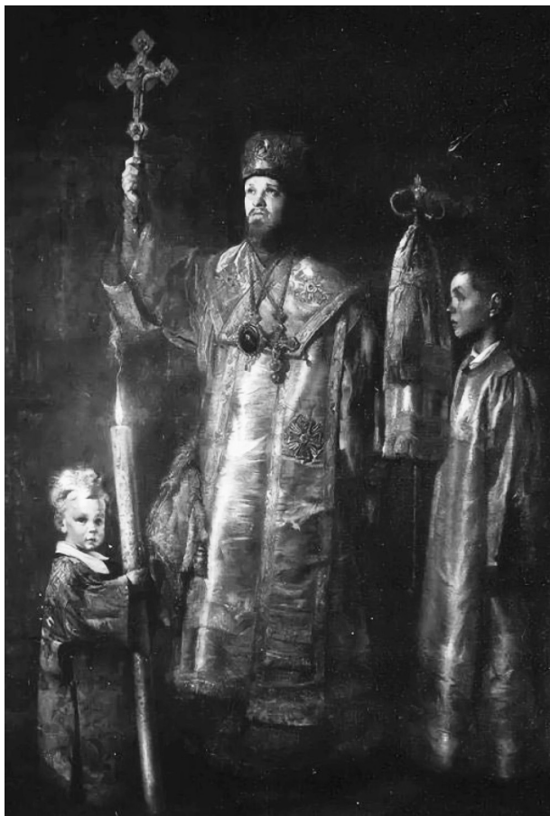
Яковлев В. Патриотическое молебствование 22 июня 1942 года в Москве (1942–1944) 1

В 2015 году картина была открыта для посетителей. Несмотря на то, что картина пролежала в свернутом виде несколько десятилетий, она сохранилась практически в первозданном виде. Потребовалась лишь незначительная реставрация.