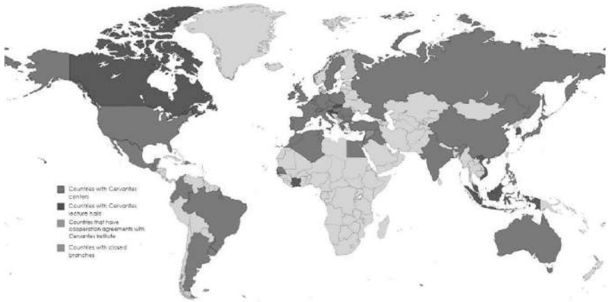
Picture 1. Distribution of the Cervantes Institute depending on various forms of cooperation 2,3

Ecuador, Argentina, Dominican Republic, Guatemala, Uruguay). What is more, the Cervantes Institute is inextricably linked with the culture of these countries, as Spain and these ones have a rich common heritage and the institute considers its heritage as an integral part of its activities [1, P. 87–89]. The largest number of ones has been signed with the institutions of Brazil, Morocco, the USA, France, Germany and Spain itself.