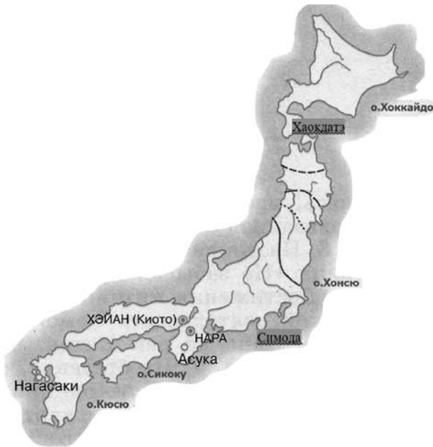
Рис. 2. Карта полученных в пользование американцами портов.