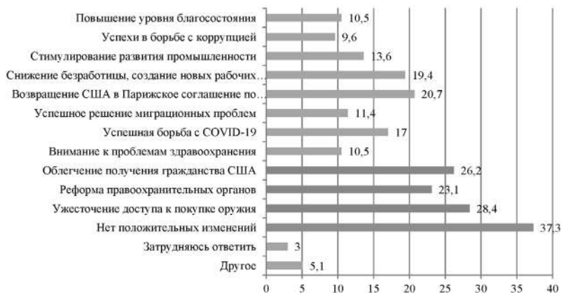
Рис. 3. Ответы респондентов на вопрос: «Какие положительные изменения в жизни США Вы связываете с именем Д. Байдена?», % 4