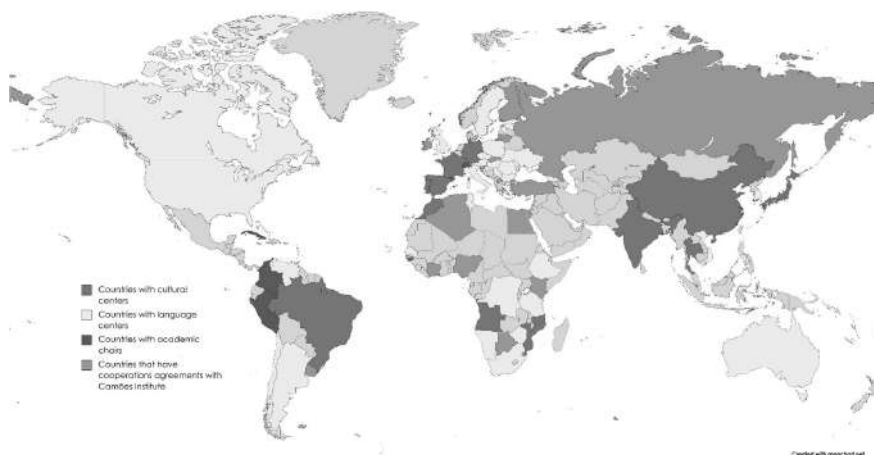
Picture 3. Distribution of the Camões Institute depending on various forms of cooperation 7

exams (CAPLE). Academic chairs are located at the universities of the country, their activity is aimed at joint research in the field of linguistics, translation and regional studies. Finally, according to operation protocols a representative of the Camões Institute is sent to the country, becomes a staff member of the institution, and carries out activities connected with dissemination of Portuguese culture. In terms of scope, the agreements are the least significant form of presence because this form of cooperation does not have the permanent territory and the ability to organise events independently, although it is the most popular form of interacting with other countries. It should be noted that the structure of the institution allows us to highlight countries with which the institute cooperates closely.