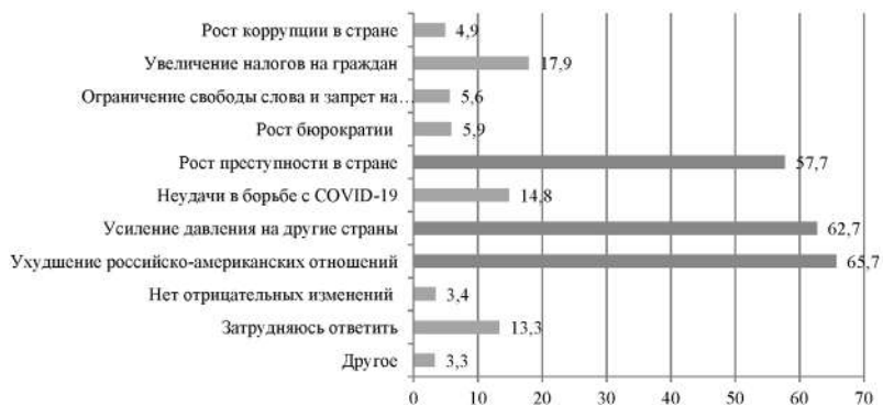
Рис. 5. Ответы респондентов на вопрос: «Какие отрицательные изменения в жизни США Вы связываете с именем Д. Байден», % 6

Дополнительно респондентам был задан вопрос об отрицательных изменениях в жизни в связи с именем каждого из президентов. В отношении В.В. Путина к числу наиболее значимых отрицательных изменений респонденты отнесли упадок экономики, сельского хозяйства, рост коррупции и ограничение сво-