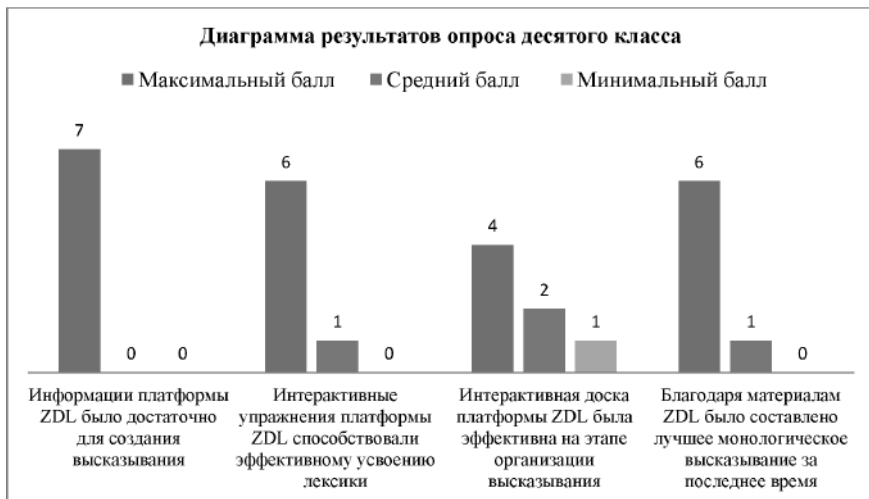
Диаграмма 1. Диаграмма результатов опроса десятого класса

Таким образом, у учащихся сложилось положительное впечатление от работы с платформой ZUM Deutsch Lernen, и абсолютно большинство учеников признало высокую эффективность внедрения материалов данной аутентичной платформы для развития умений монологической устной речи. Исключением выступает спорное отношение к работе с интерактивной страницей