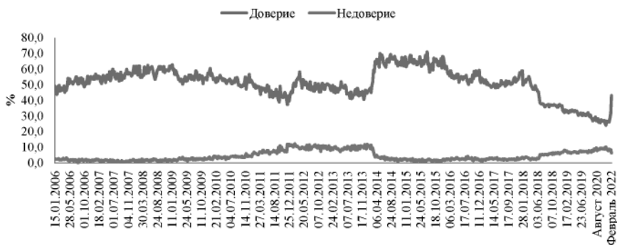
Рис. 6. Оценка уровня доверия В.В. Путину (по данным ВЦИОМ), % 7

В отношении отрицательных изменений в жизни США в связи с именем Дж. Байдена респондентами были отмечены: ухудшение российско-американских отношений (65,7% ответов), усиление давления на другие страны (62,7%), рост преступности в стране (57,7%).