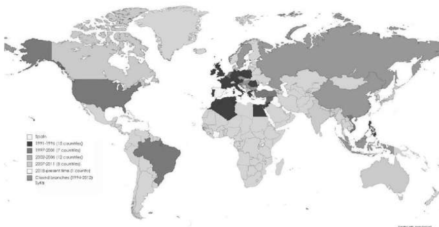
Picture 2. Stages of the spreading of the Cervantes Institute 4,5

eastern states (Russia, China, Indonesia, Malaysia, later India and Japan). The development of the institute was considerably influenced by the Spanish financial crisis (2008–2013). In 2011, the institute for the first time had a negative budget growth, meanwhile the peak of the fall in investments occurred in 2013 (–37.3%). Indeed, the rate of expansion begins to decline at that time. The Instituto Cervantes appeared in 8 more countries between 2007 and 2011 year, mainly in the form of classrooms. There were a number of necessary measures because of the financial difficulties, for instance, the institute sold some of its own buildings, relocated or abandoned some centres, such as at Brazilian Florianópolis and Morocco. From 2011 to the present time, the Institute has appeared in only four new countries: a centre in Senegal (2021), classes in Côte d’Ivoire (2020), and expansions in Ramallah (2021) and Baghdad (2021).