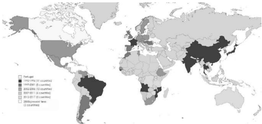
Picture 4. Stages of the spreading of the Camões Institute

Portuguese-speaking countries, as well as in the largest Asian countries (China, India, Japan, Thailand). The second wave of distribution of the Camões Institute was in the mid-2000s, when branches were opened in most Western countries, including the USA, Germany, Sweden, etc. After a break due to the 2008 crisis, in the second decade of the 21st century, Portugal opened centres in Eastern European region (Moldova, Ukraine) and in a number of non-Portuguese countries in Africa and Asia (Zimbabwe, the Democratic Republic of the Congo, Vietnam). Over the entire period, the Camões Institute has established centres in 49 countries around the world. It is worth mentioning that Portugal opens branches in countries where Portuguese is the official language, due to the small proportion of Portuguese speakers in these countries and the widespread use of dialects and indigenous languages (African countries, East Timor) [4, P. 10].