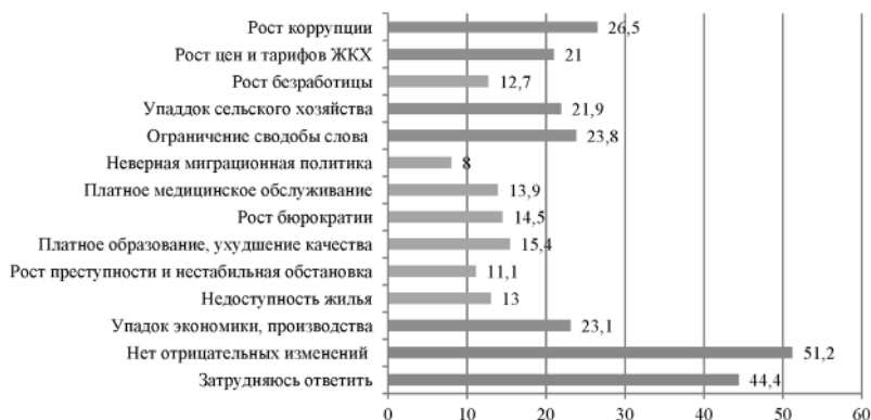
Рис. 4. Ответы респондентов на вопрос: «Какие отрицательные изменения в жизни России Вы связываете с именем В.В. Путина?», % 5