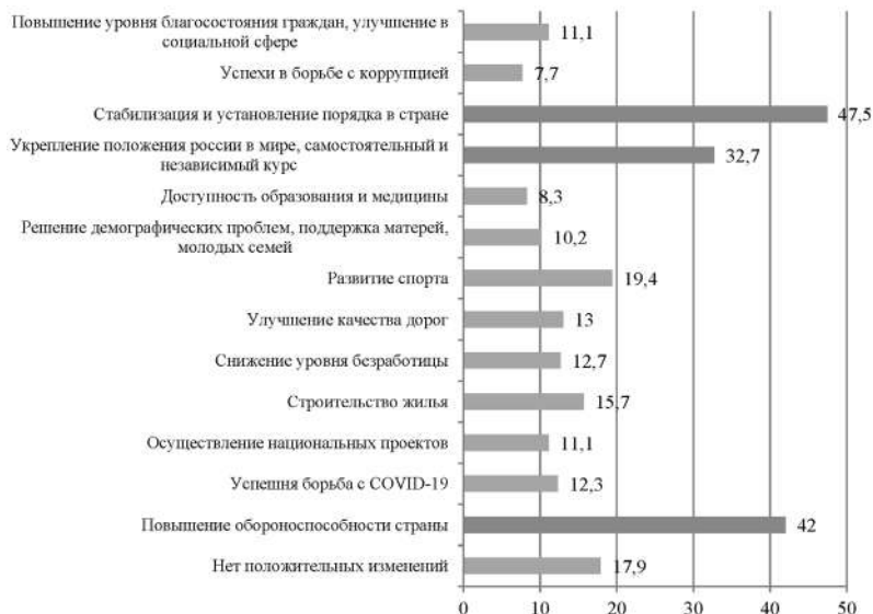
Рис. 2. Ответы респондентов на вопрос: «Какие положительные изменения в жизни России Вы связываете с именем В.В. Путина?», % 3