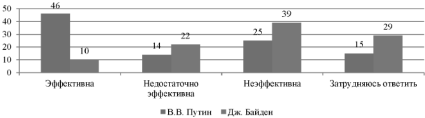
Рис. 1. Распределение ответов респондентов на вопрос «Оценка респондентами эффективности деятельности Президента Российской Федерации / США», % 2

69% респондентов ответили, что Дж. Байден уже стар для управления страной, против 33% — у В.В. Путина. В то же время, более половины респондентов (52%) отметили, что В.В. Путин находится в самом подходящем для президента возрасте.