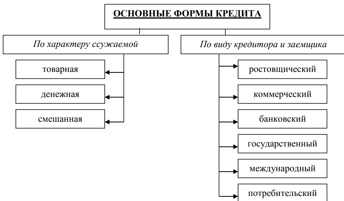
Рисунок 1.1 - Классификация основных форм кредита (где «первая» цифра «1»- номер главы, «вторая» цифра «1» номер рисунка в главе по порядку)