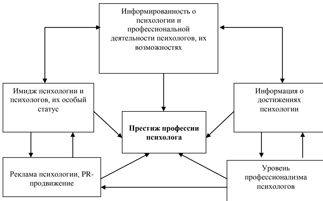
Рис. 4. Психологическая модель престижа профессии психолога

Полученные в эмпирическом исследовании научные и практические результаты позволили решить другие задачи диссертационного исследования, связанные с их теоретическим обобщением и разработкой психологической модели престижа профессии психолога как системы объектов и знаков, воспроизводящая существенные свойства объекта-оригинала - идеального персонифицированного или неперсонифицированного образа профессионала или эталона продуктивного личностно-профессионального развития. В проведенном теоретическом и эмпирическом исследовании были получены результаты, позволяющие феномен престижа профессии психолога представить в виде обобщенной модельной схемы (рис. 4).