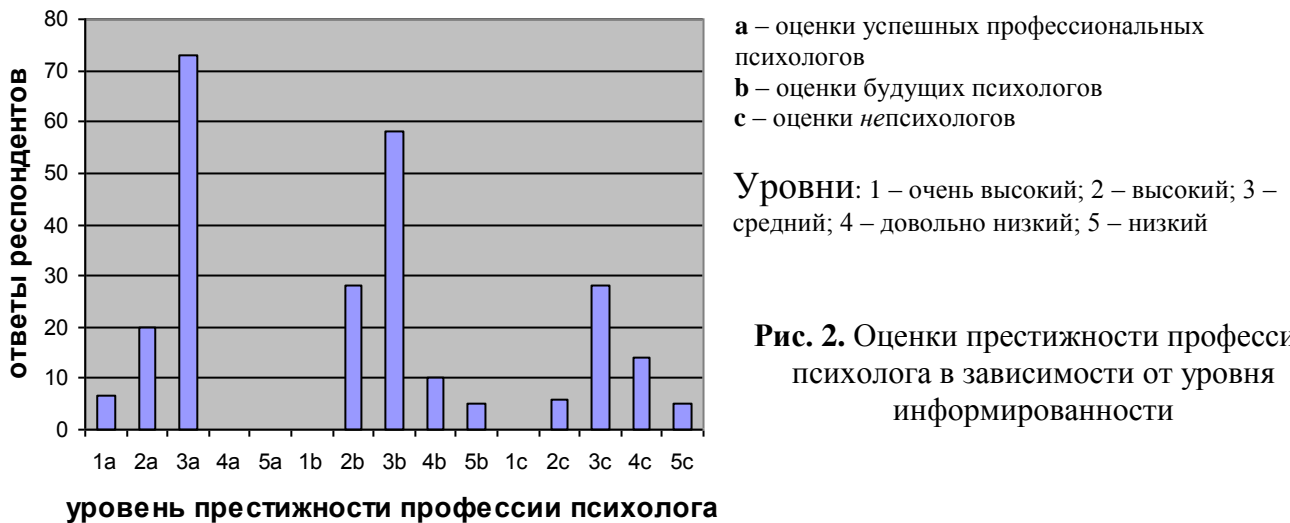
Рис. 2. Оценки престижности профессии психолога в зависимости от уровня информированности